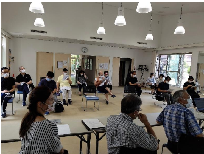
三密を避けた会の様子

次回は、今年度選出された第2期地区委員も参加した総勢42名での開催を予定しています。町内会の諸活動を支える大きな原動力になることが期待されます。